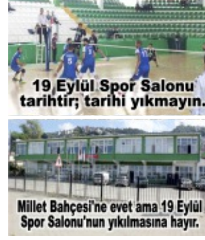
19 Eylül Spor Salonu tarihî fotoğrafı.