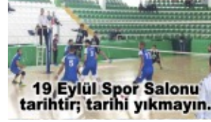
19 Eylül Spor Salonu tarihî fotoğrafı.