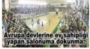
Avrupa devlerine ev sahipliği yapan salonuma dokunma.

2023-2024 futbol sezonunda Giresun'u Trendyol 1. Lig'de temsil eden Bitexen Giresunspor, 3.ligde mücadele veren Amber Çay Eynesil Belediyespor ve Bölgesel Amatör Ligde yıllardır yer alan Görelespor bir alt lige düştü