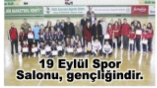
19 Eylül Spor Salonu, gençliğindir.